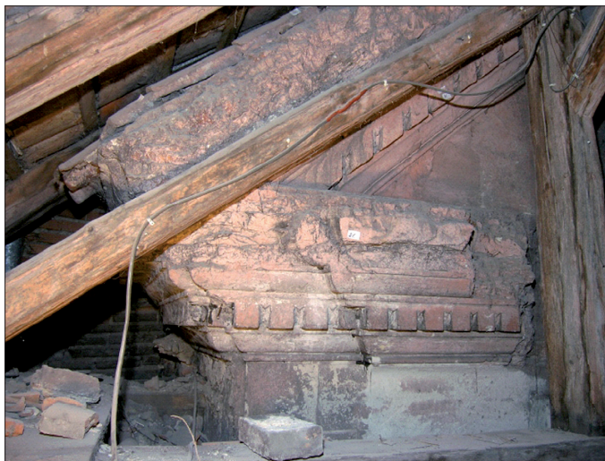
Obr. 8. Původní, pravděpodobně barokní štít zaniklého kostela. Na spodní části profilace římsy je rozeznatelný „zubořez“.