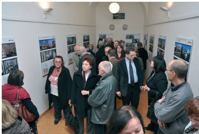
Obr. 16. Vernisáž výstavy Meziválečná architektura Střešovic.

V dalším čísle se budeme věnovat zástavbě na jih od Střešovické ulice k hranicím katastru Břevnov a poslední článek bude věnován jednomu z fenoménů Ořechovky – oplocení, jehož tvarová i materiálová bohatost i stupeň zachování jsou nevídané.