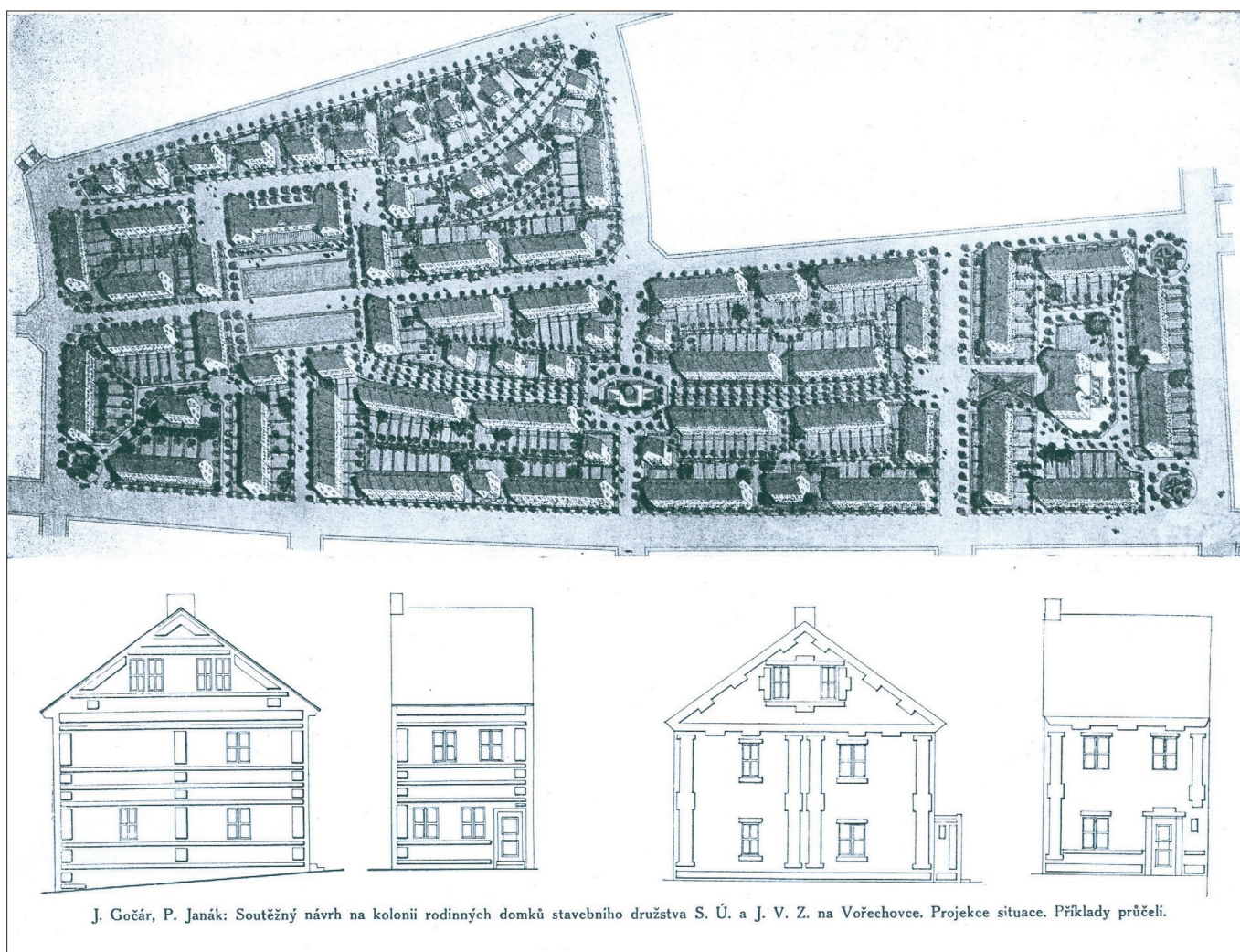
J. Gočár, P. Janák: Soutěžný návrh na kolonii rodinných domků stavebního družstva S. Ú. a J. V. Z. na Vořechovce. Projekce situace. Příklady průřelů.

Obr. 1. Praha 6-Střešovice, část vilové kolonie Ořechovka. Josef Gočár, Pavel Janák, 1919, axonometrická situace a návrhy fasád řadových domků. Soutěžní projekt architektů Gočára a Janáka nebyl mezi oceněnými. „Architektura nejmodernějšího směru nevyjadřuje konstrukci ani ji nerespektuje, aby dosažena byla rozmanitost, jsou domky různě barveny. Zásady vyjádření materiál a konstrukci v architektuře autoři úplně zavrhuji“ (převzato z SF 1919, 97).