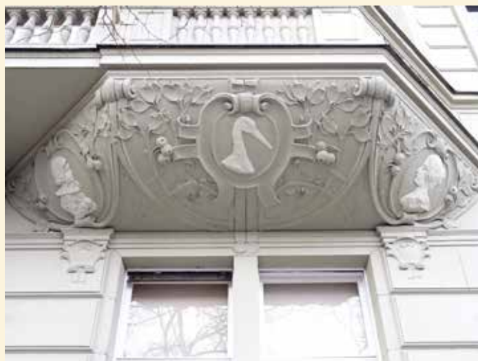
Obr. 29A–B. Praha 2-Vinohrady, čp. 1332. Firma Kuneš a Rákosník, 1905: výzdoba konzol balkonu domu v Kladské 13.

původní zdobnou neorenesanční fasádu s ženskou personifikací v nice středního štítu. Dekorace tohoto průčelí patří k četným příkladům prací Kunešovy a Rákosníkovy firmy, které zcela zanikly v důsledku pozdějších purizujících úprav.