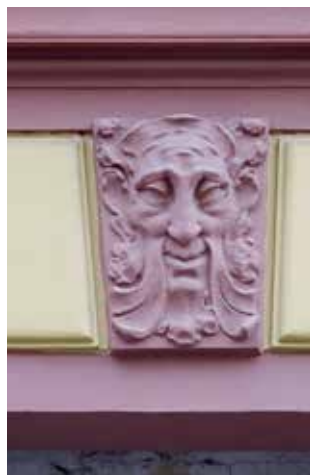
Obr. 4. Praha 8-Karlín, čp. 410. Firma Kuneš a Rákosník, 1903: maskaron v přízemí domu v Kolláro- vě 4 (foto autor, 2018).