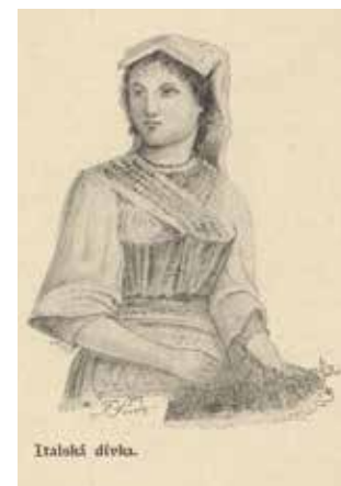
Obr. 4. Jaroslav Pantaleon Major, 1901: Římské studie: Italská dívka ( Římská květinářka ). Kresba podepsaná pseudonymem Jaroslav z Chotče, datovaná v Římě 1901 (převzato z MAJOR 1909, 233; publikováno poprvé DOSTÁL LUTINOV 1901, 264).