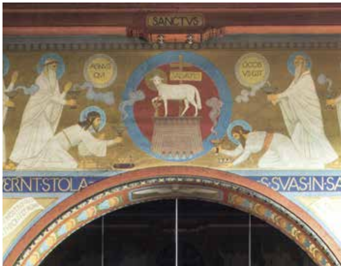
Obr. 9. Praha 5-Smíchov, klášter sv. Gabriela. Klanění Beránkovi , nástěnná malba na vítězném oblouku v kostele Zvěstování Panně Marii. Výzdobu kostela podle návrhu P. Desideria Lenze provedla Beuronská umělecká škola, mezi 1895–1899. Fotografie nesignovaného a nedatovaného nákresu této výmalby vítězného oblouku je zachována v Majorově pozůstalosti (SA Žaludových; foto M. Šeba, 2016).

Beuronská umělecká škola pro obláty aj. byla oficiálně zřízena benediktinem P. Desideriem Lenzem (1832–1928) v mateřském klášteře v Beuronu ve Švábsku v roce 1894 (výuka probíhala už i dříve) a rozvíjela se i v některých dceřiných klášteřích beuronské kongregace. Vychovávala mladé talentované muže, kteří se většinou stali mnichy a pracovali na výzdobě klášteřů a kostelů v Evropě i v zámoří. Tvorba této školy byla zaměřena na beuronské umění, které má svůj počátek ve stavbě kaple sv. Maura u Beuronu z konce 60. let 19. století. Jedná se o sakrální umělecký směr, který zásadně ovlivnila tvorba starého Egypta a postupně jej obohatily především prvky řeckého umění a výzdoba starokřesťanských bazilik. Figury Lenz vytvářel podle kánonu lidského těla, který se opíral o starozákonní citáty z knihy Moudrosti (Mdr 11,20) a o podobné snahy starověkých a renesančních umělců. Malby v beuronských interiérech jsou doprovázeny vysvětlujícími latinskými nápisy a citáty z Písma, psanými specifickým beuronským písmem s mnoha zkratkami (obr. 8; k Beuronské umělecké škole viz např. ČIŽINSKÁ 1997; 2007, 152–154; 2017).