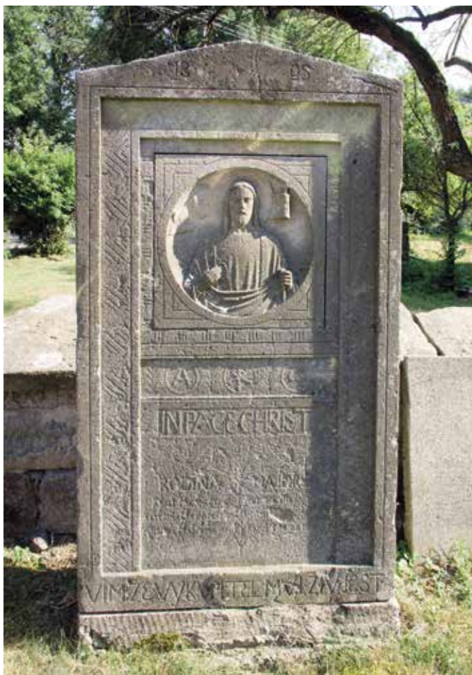
Obr. 10. Choteč, hřbitov. Stéla nad hrobem rodiny Majorových, 1895. Příznivé nasvícení západním sluncem umožňuje vidět detaily, které při běžném osvětlení zanikají.

beuronského stylu (KLAZAR 2018, 84–85). Vzhledem k dataci a skutečnosti, že náhrobník pochází z hrobu rodiny Majorových, se lze domnívat, že byl vyhotoven podle návrhu Pantaleona Majora. 20 Je možné, že jde o první provedení jeho návrhu a zároveň nejstarší známou památku Beuronské umělecké školy v regionu Majorova rodiště (obr. 10).