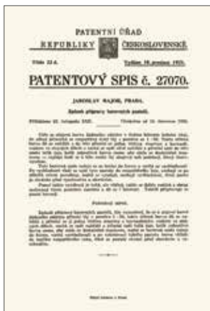
Obr. 34. Patentový spis č. 27070 z 10. prosince 1928 chránící Majorův speciální postup na výrobu barevných pastelů (převzato z ÚPV 27070 online).

sign. IX/0620) Pozvánky na spolkové akce byly zveřejňovány v tehdejším tisku. Na jaře 1927 se mezi nimi dokonce objevila nabídka na komentovaný zájezd za italskými památkami a slibovala navštívit Benátky, Padovu, Florencii, Assisi, Řím, Neapol, Capri a Pompeje ( sine 1927a, 6). Tuto Majorovu spolkovou aktivitu také připomíná Prokop TOMAN (1993/II, 64): „Byl hlavním iniciátorem spolku ‚Památková matice chrámová‘. Tak restauroval na př. fresky v kapli Srdce Ježíšova u Křížovníků v Praze, na Tetíně a j. Vynašel zvláštní metodu restaurování, t. zv. pastelovým olejem, čímž dosahuje starého rázu a patiny.“ Je hříčkou náhody, že patentový spis chránící Majorovu recepturu k přípravě zmíněného speciálního pastelu, byl vydán v den jeho 59. narozenin 10. prosince 1928 (ÚPV 27070 online; obr. 34).