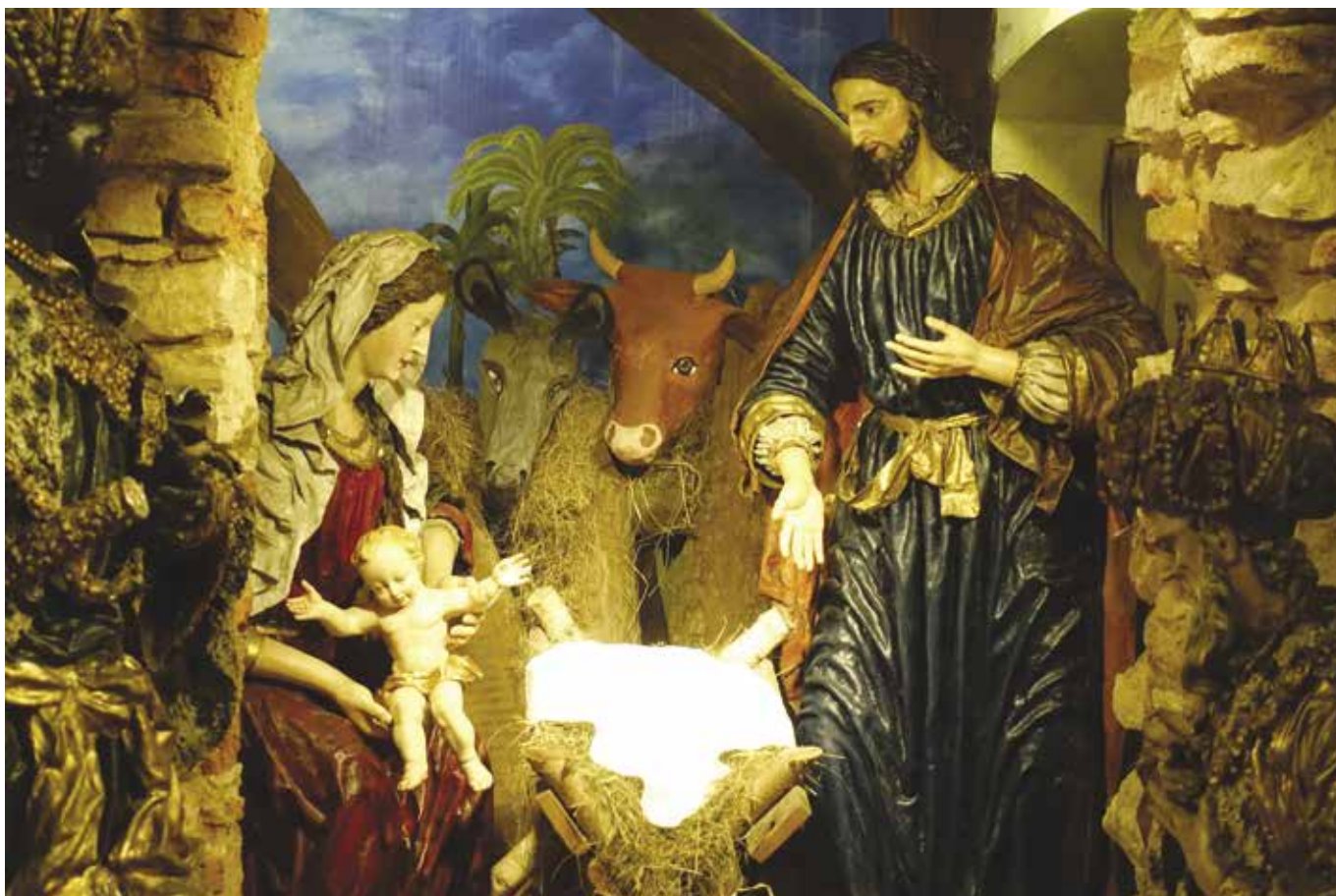
Obr. 7. Praha 1-Hradčany, kostel Panny Marie Andělské, kapucínské jesličky. Detail sv. Rodiny.