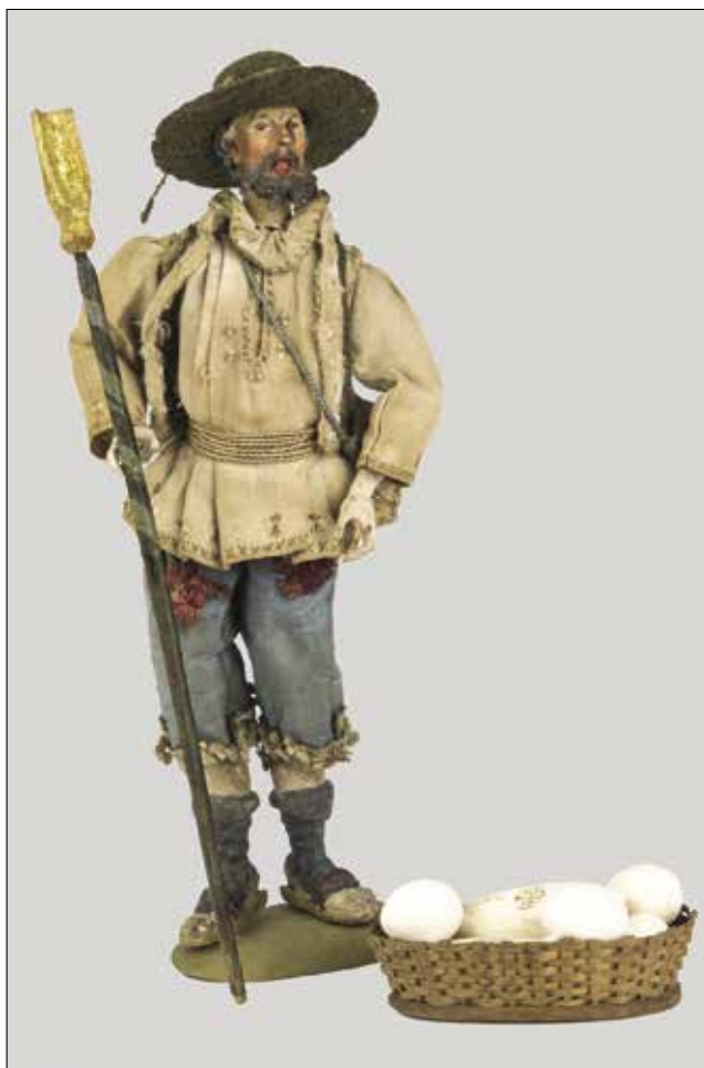
Obr. 4. Pastýř s lopatou (něm. Gabenkorb), figura z Jaufenthaler Krippe z Tyrolska, pozdní baroko, Volkskundemuseum Wien, inv. č. ÖMV/9.803 (, dostupné na < https://volkskundemuseum.at/jart/prj3/volkskundemuseum/images/img-db/1445004506531.jpg > [vid. 2020-09-29]).