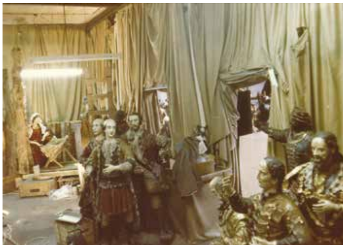
Obr. 10. Praha 1-Hradčany, kostel Panny Marie Andělské, kapucínské jesličky. Dobová fotografie z rekonstrukce klášterní chodby a průběhu nové instalace betlému v letech 1965–1967 (soukromý archiv,).