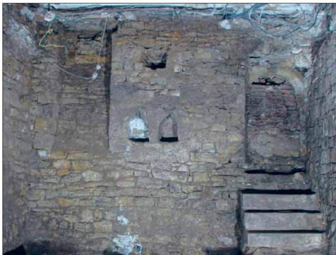
Obr. 4. Východní stěna nově odkrytého sklepa – stav po odkrytí. Vlevo výklenek s větracím okénkem, uprostřed dvojice odkládacích nik s kapsou pro průvlak nad nimi, vpravo portál vstupu z východní části parcely se spodním úsekem schodiště. Pohled od západu.

Zajímavé je i porovnání stavebního vývoje suterénu se známými písemnými prameny. V roce 1331 vydala staroměstská městská rada nařízení o nutnosti dláždít ulice a v něm zmiňuje i odstranění vstupních šjíj do sklepů, umístěných v ulicích i podloubích (LEDVINKA/PEŠEK 2000, 134). Byl-li tento příkaz striktně dodržován, pak by přítomnost zazděného vstupu do sklepa přímo z podloubí nasvědčovala vzniku domu již před rokem 1331 a odpovídala by pak i datování jižní části podloubí. Už tehdy ale byly možné výjimky – u staveb, které měly nad podloubím obytné prostory. Tak tomu asi