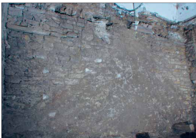
Obr. 6. Severní stěna nově odkrytého sklepa před očištěním se zachovaným otiskem před zasypaním odstraněného kužele jílovité hlíny. Pohled od jihozápadu.