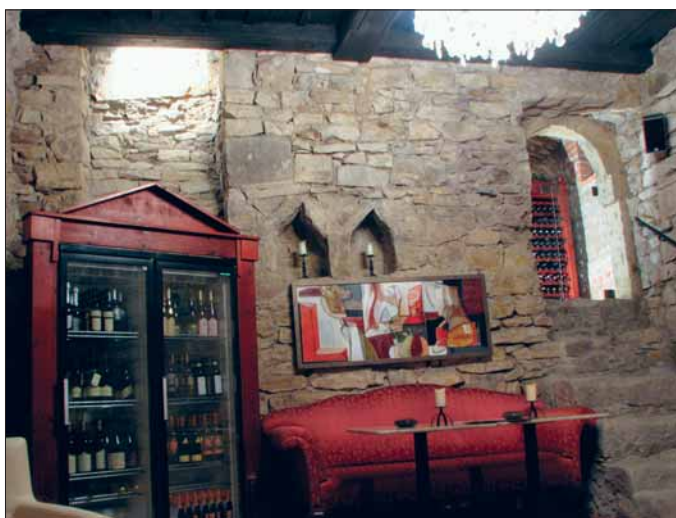
Obr. 5. Východní stěna nově odkrytého sklepa – stav po restaurování (foto J. Hlavatý).