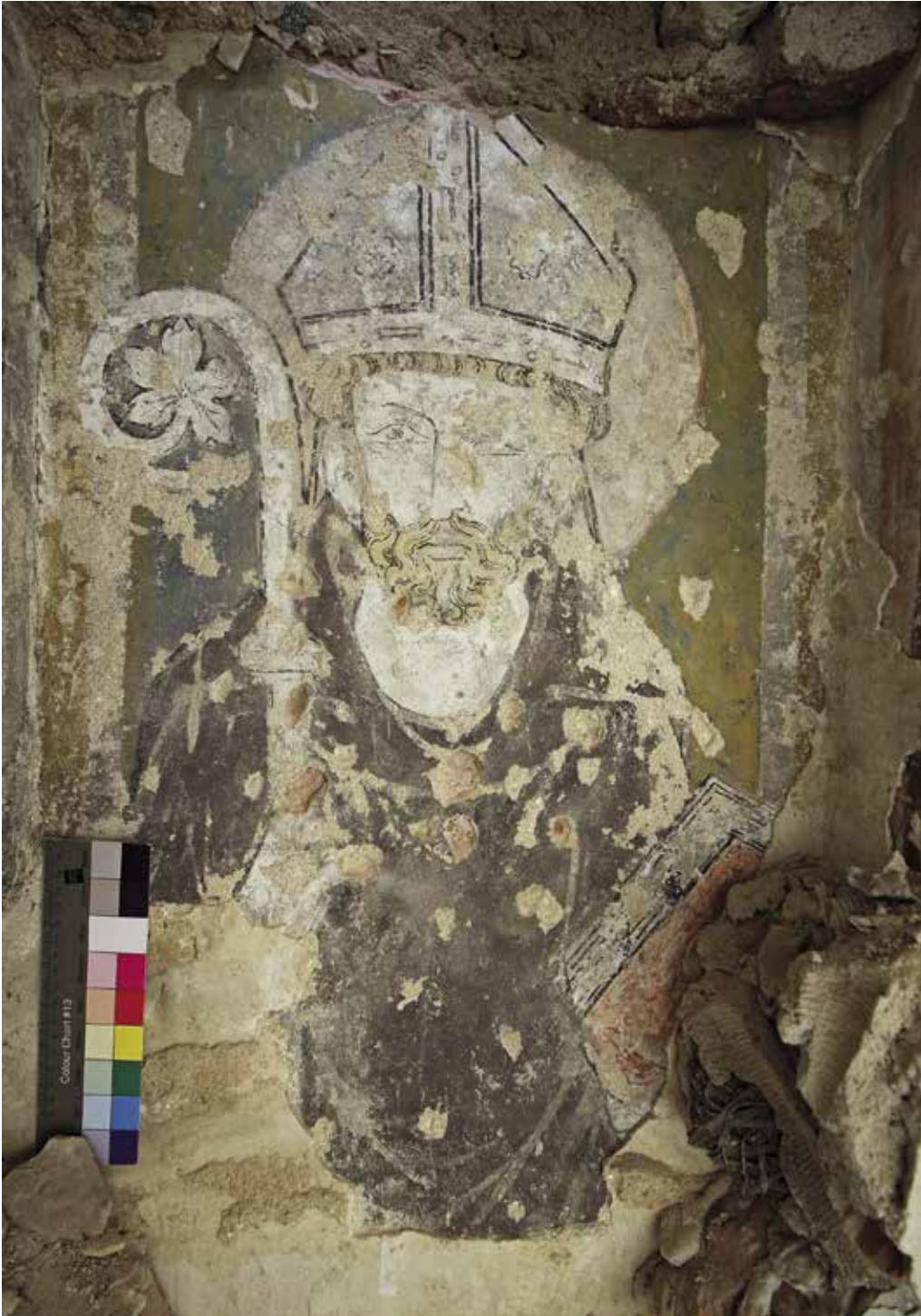
Obr. 4. Praha 1-Staré Město, čp. 510, odkrytá část malby svatého biskupa (foto autor, 2016).

Odkrytá část nástěnné malby představuje mimořádně dobře zachovanou postavu svatého biskupa nebo, jak nelze zcela vyloučit, svatého opata, zobrazenou frontálně, téměř v životní velikosti, oděnou do tmavého řádového roucha s mitrou na hlavě, na pozadí s kruhovou svatozáří s červenou konturou. 7 V pravé ruce přidržuje berlu, jež má v horní části patrný nodus a v zakončení stočeném směrem vně od hlavy světce detailně prokreslený stylizovaný pětist. V levé ruce svírá knihu v červené vazbě (obr. 4). Tvar očí je mírně protažený, mandlovitý, s pohledem upřeným mírně šikmo na diváka. Plynulá linie spojuje obočí s nosem. Plné rty jsou obklopeny symetrickými, bohatě zvlněnými vousy. Zdobená mitra na světcově hlavě zakrývá kratší zvlněné vlasy. Inkarnát je pojednán v bílé, pro oživení jsou linie nosu vedle černé linky zvýrazněny také červenou. Barva vlnitých vlasů a vousů je žlutá.