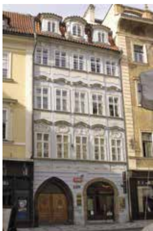
Obr. 1. Praha 1-Staré Město, Malé náměstí 2, dům čp. 143/I „U Bílého lva“, ppč. 105 (foto R. Gája, 2016).

Key words — Prague-Old Town – Simon of the White Lion – Hussite rebellion – medieval town – rural estates – libraries