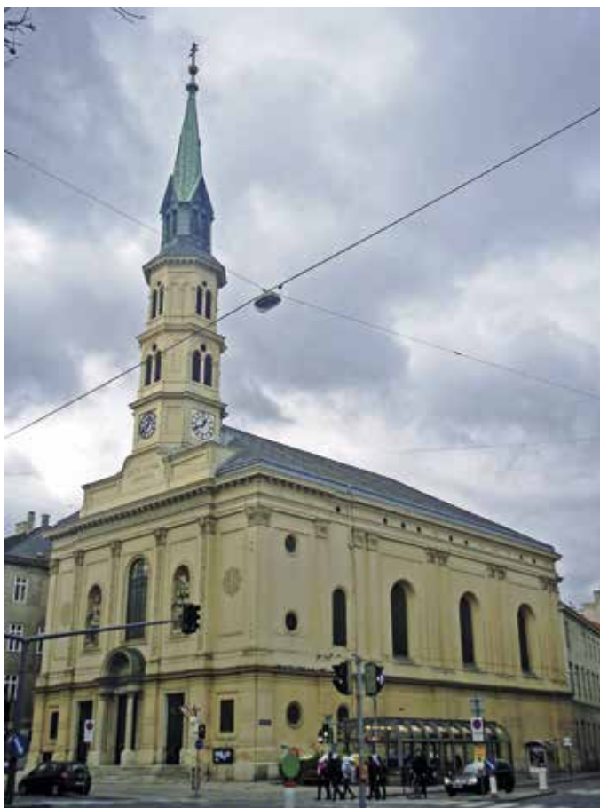
Obr. 6. Vídeň, Leopoldstadt, kostel sv. Jana Nepomuckého na Praterstraße z let 1841–1846 podle projektu K. Rösnera.

sochařem Václavem Levým ( sine 1853, 478), který se následně podílel na výzdobě novostavby. Autorem návrhu freskové výzdoby byl při té příležitosti malíř Josef Mánes, jehož reálný podíl na výzdobě chrámu byl nakonec značně umenšený.