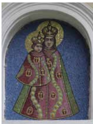
Obr. 5. Červený Újezd – Hájek, františkánský klášter. Panna Maria Hájecká na vstupní bráně kláštera z roku 1908.