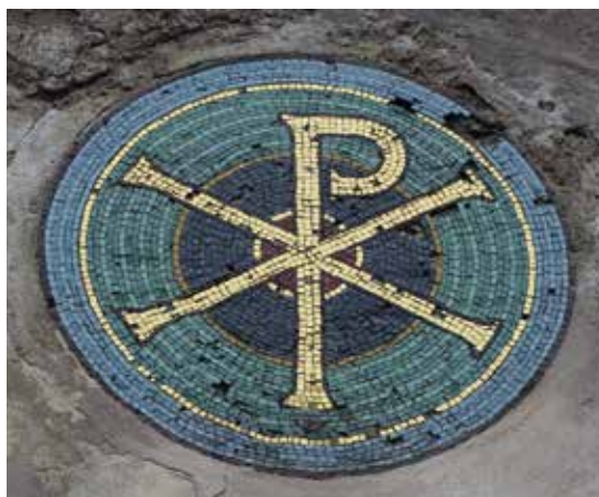
Obr. 6. Praha 5-Hlubočepy, kaple Panny Marie Bolestné. A – výzdoba průčelí kaple s christogramem, písmeny alfa a omega a nápisem AVE MARIA GRATIA PLENA z roku 1903; B – detail christogramu.

trvat po dvě léta (KOLÍSEK 1903, 5). Bohužel ani tehdy nebyla zakázka dokončena: „... přece otálel s provedením, tak že roku 1905 v měsíci říjnu, kdy práce mohla být již úplně hotova, byl s ní teprve v počátcích.“ Intervence tarbsko-lurdského biskupa v roce 1905 ho měla popohnat s tím, že pokud na mozaice nebude pracovat, má ji předat jiným. Foerster se tedy práce vzdal, bylo mu vyplaceno odškodné ve výši 2000 K (KOLÍSEK 1908, 10) a mozaiku nakonec provedla pařížská firma Faschin. 39 Je otázkou, čím byl neúspěch lurdské zakázky způsoben, protože, jak je patrné i z předchozího výčtu zakázek, produkce mozaikářské dílny se zatím v Čechách úspěšně rozvíjela. Možná právě dostatek jiné činnosti a snaha o prosazení podniku a nové techniky v českém prostředí dílnu brzdily v práci pro francouzské poutní místo.