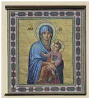
Obr. 4. Praha 1-Nové Město, kostel Panny Marie Sněžné. A – Panna Maria Sněžná v průčelí kostela z roku 1904; B – detail mozaiky.

Výzdoba fasády je situována v centrální části budovy Petrina. Upozorňuje na kostel Panny Marie Růžencové, který je skrytý na dvoře za budovou čp. 251 a do něhož ústí dlouhá chodba vedoucí z Žižkovy třídy 6. Vstup ke kostelu je po stranách rámovaný dvěma pískovcovými reliéfy andělů, které měl původně vytesat také Viktor Foerster, ale nakonec je zhotovili žáci hořické kamenosochařské školy (KLAZAR 2017 online, v tisku). V tympanonu portálu je osazen panel s mozaikovou polopostavou Vítězného Krista, držícího v rukou rozevřenou knihu s písmeny alfa a omega. Výše je v centru fasády osazena nejdůležitější část výzdoby – téměř čtvercové pole s centrálním