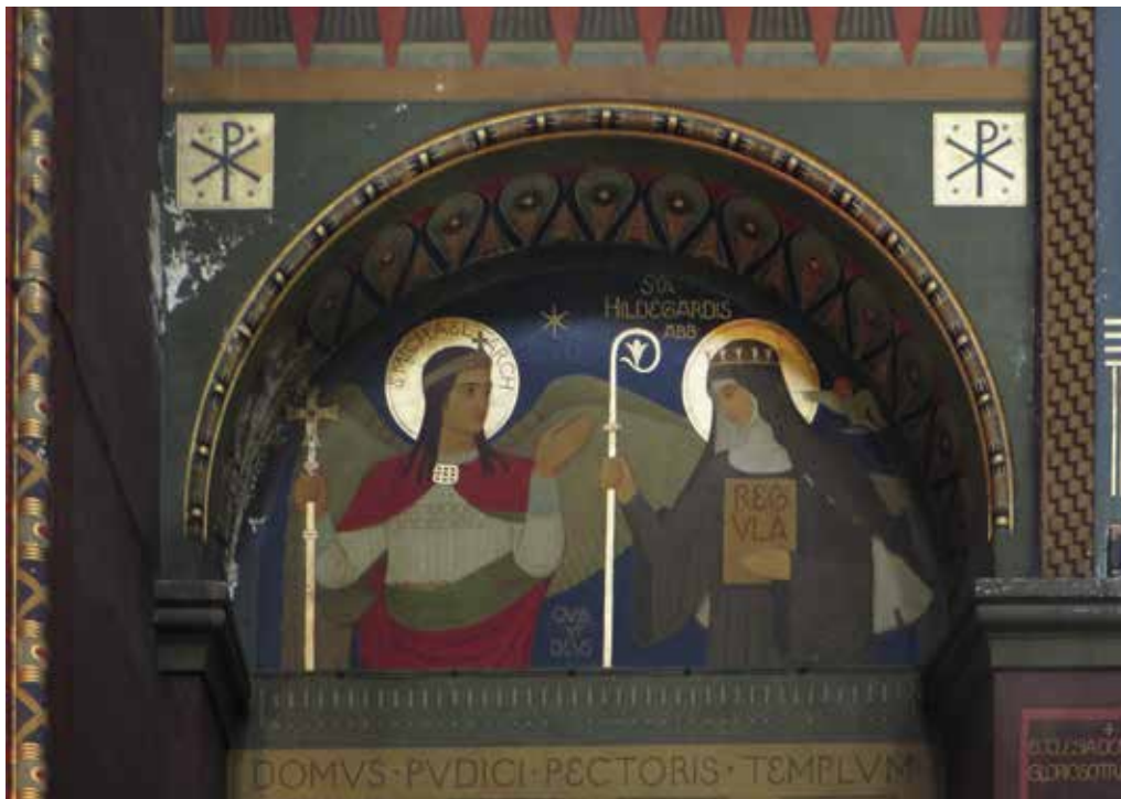
Obr. 5. Praha 5-Smíchov, klášter sv. Gabriela. Archanděl Michael posílá sv. Hildegardu založit nový klášter do Eibingenu v Porýní. Nástěnná malba v kostele Zvěstování Panně Marii, jižní stěna lodi, návrh P. Desiderius Lenz, provedení Beuronská umělecká škola, mezi 1895–1897.