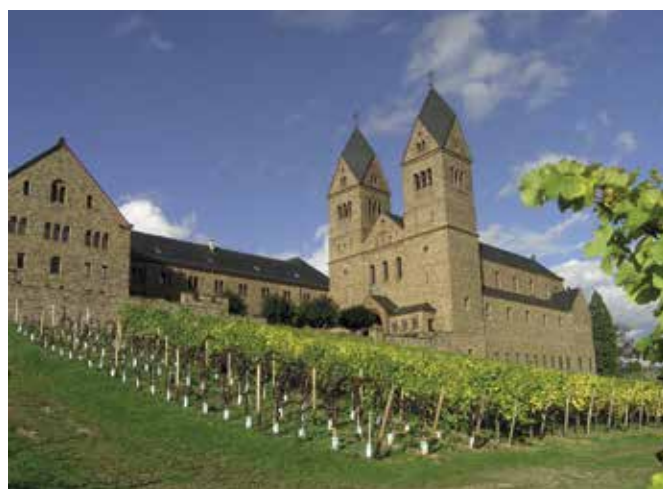
Obr. 3. Opatství St. Hildegard v Eibingenu od východu.