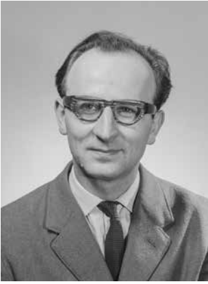
Obr. 5. Aleš Vošahlík (1934–2001), architekt a historik urbanismu a architektury, spoluvůrce metodiky prohlášení památkových rezervací, významný teoretik památkového urbanismu. V letech 1991–2002 koordinoval zpracování návrhů na zápis českých památek na Seznam světového dědictví. Portrétní foto z 80. let 20. století (NPÚ GnŘ, fotografická dokumentace, neznámý fotograf, bez datace).

předsedou (v konkrétním případě předsedkyní) přímo vyzván, abych doplnil podané informace, případně i vyjádřil svůj názor na projednávanou věc. Účast pozorovatelů na sezení Výboru jim nicméně dávala širokou možnost lobbovat o přestávkách mezi jednáními za úspěch návrhů jejich států.