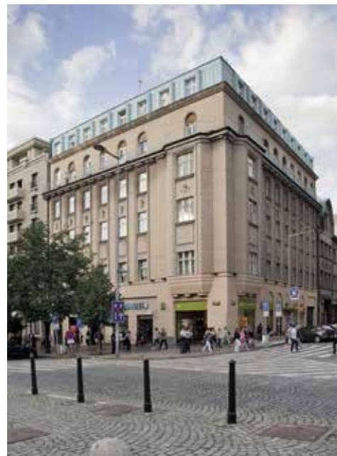
Obr. 9. Praha-Nové Město, Václavské náměstí čp. 1601. Rohový dům, citlivě architektonicky kvalitně přestavěný významnými architekty Bohumírem Kozákem a Josefem Zaschem v roce 1921. Jeho současná vandalská demolice je nesmírně nebezpečným precedencem pro zacházení s kulturními hodnotami pražské památkové rezervace.

těžce poškozený betonovými vnitřními konstrukcemi nových vložených pater a dehonestujícím způsobem užívaný či postupně rozpadající se areál Sixtova domu na Starém Městě. A nejnověji, v letošním roce, je to architektonicky kvalitní Kozákův a Zascheho dům na Václavském náměstí, jehož barbarská demolice právě skončila (obr. 9).