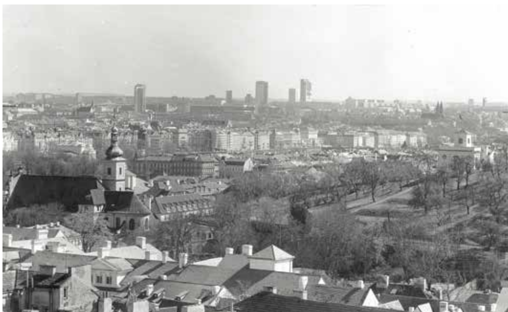
Obr. 11. Praha, 1999. Pohled na město zachycující jeho panorama víceméně v podobě, jakou mělo v době zápisu na Seznam světového dědictví. Jeho integritu již narušují zatím ojedinělé výškové stavby z 80. let 20. století na předpolí Nuselského mostu a pankrácké pláně (Spisovna IPR Praha, sign. F-PP-000048-003, 1999).