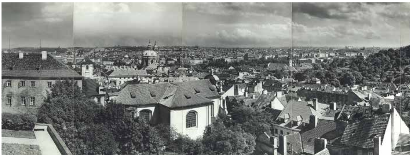
Obr. 10. Praha, panorama města z Pražského hradu, 1973. Snímek ukazuje historické jádro města ještě před vznikem výškových staveb. Má charakteristickou urbanistickou skladbu s vyrovnanou hladinou zástavby a působivými vertikálami historických dominant (Spisovna IPR Praha, sign. F-PP-000009-001,).

bonus nové kvality v podobě vynikajících architektur současnosti, které by svou úrovní odpovídaly hodnotě prostředí, ve kterém vznikají. V tomto směru naše současnost daleko zaostává za čtyřicetiletým poválečným vývojem, v němž navzdory svízelným podmínkám čeští architekti vyzdorovali vznik řady vysoce pozoruhodných, dnes bohužel rovněž mizejících staveb. Ze současné neutěšené situace nelze prvoplánově vinit dnešní architektky; většinou developerů jde prostě jen o rychle návratný zisk z jejich investic a nikoli o obohacení architektonických hodnot Prahy. Projektanti s vědomím konkurence ve vlastních kruzích pak vycházejí takovým zadáním bez odporu vstříc.