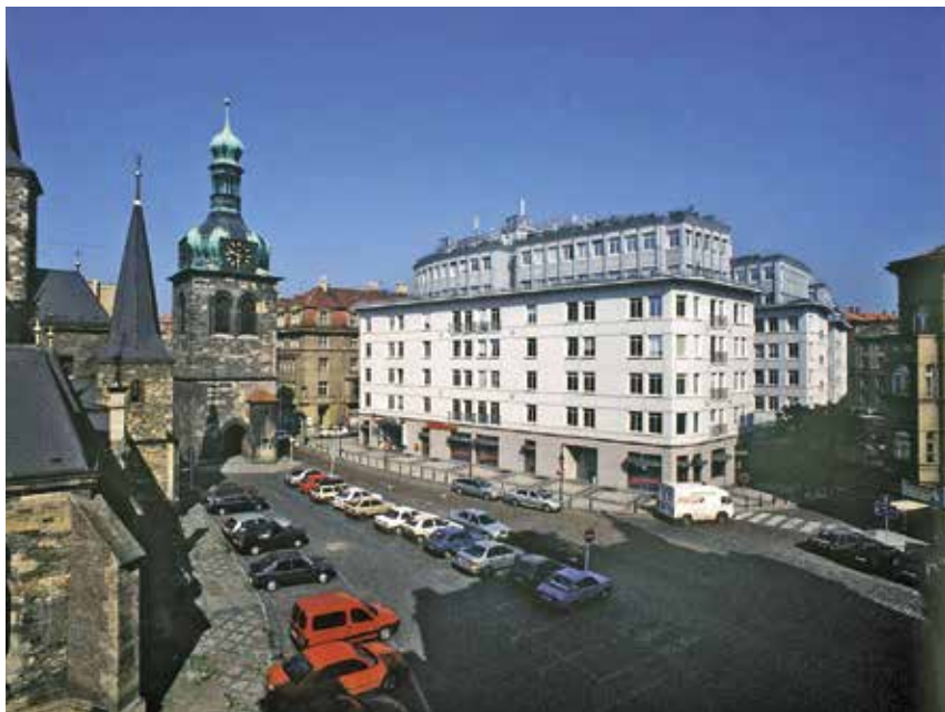
Obr. 8. Praha-Nové Město, Petruská čp. 1216. Novostavba Praha City Center z let 1993–1995. Masivní, vtíravá, a přitom plytká architektura je v přímém optickém kontaktu s gotickým kostelem sv. Petra na Poříčí. Nahradila hodnotný neobarokní Špačkův dům. Jde o první velkou prohru památkové péče v Praze po jejím zápisu na Seznam světového dědictví.