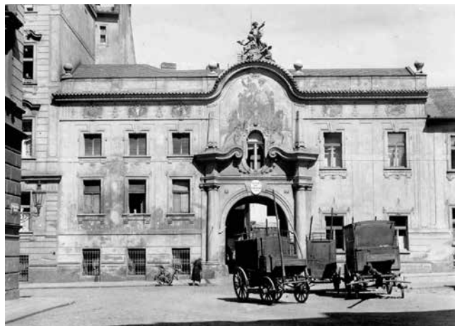
Obr. 7. Praha-Nové Město, čp. 1216. Neobarokní konírna areálu bývalého Špačkova domu zbudovaného roku 1901, boční průčelí směrem do Lodecké ulice, stav na dobové fotografii kolem roku 1940. Hodnotná historická architektura byla v roce 1993 zbořena kvůli developerskému projektu administrativních budov Praha City Center (NPÚ GnŘ, fotografická dokumentace, neznámý fotograf, kolem 1940).