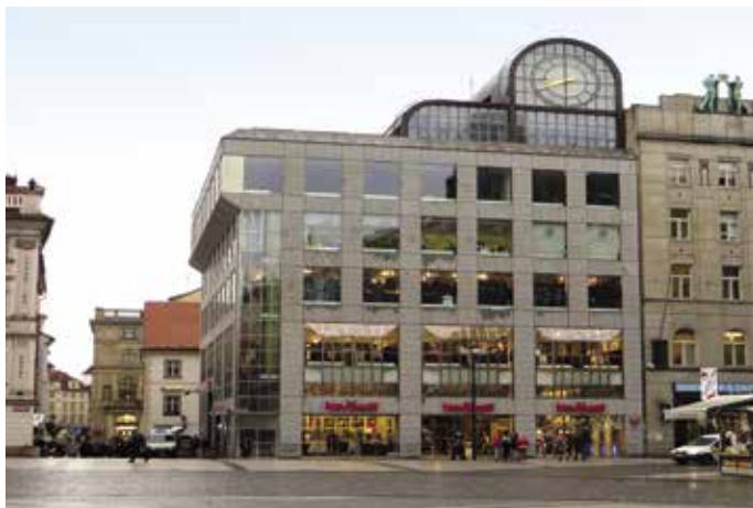
Obr. 6. Praha 1-Staré Město, Na Příkopě čp. 388. Bývalý dům ČKD Na Můstku od Jana a Aleny Šrámkových, 1974–1983. Příklad veskrze soudobé, a přitom vysoce kontextuální architektury, která se harmonicky včlenila do dolní části Václavského náměstí. Vysoká kvalita nových architektur vkládaných do historické zástavby Prahy nebyla v desetiletích před rokem 1989 výjimkou, po roce 1990 lze z nemnoha povedených novostaveb připomenout např. Tančící dům na Rašínově nábřeží z let 1994–1996 od Franka O. Gehryho a Vlada Miluniće.