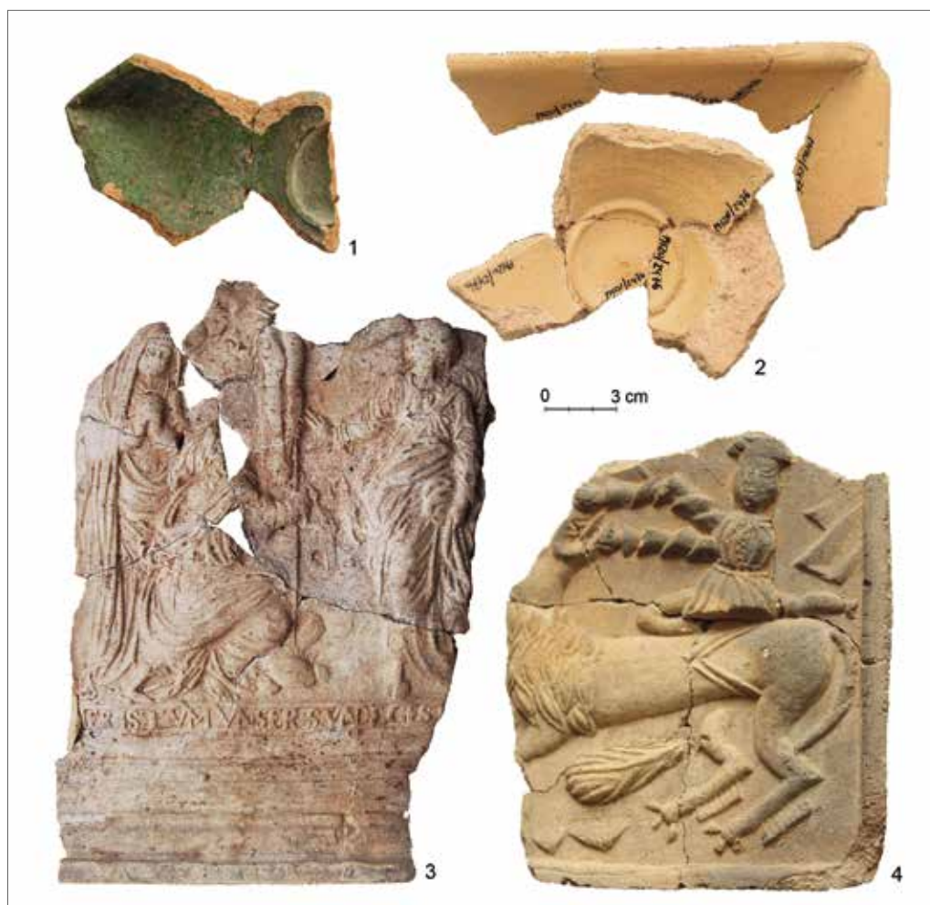
Obr. 12. Praha 1–Hrad, Zlatá ulička, výzkum Archeologického ústavu AV ČR, Praha. Výběr z nálezů kachlové produkce ze souvrství v ploše komunikace Zlaté uličky: 1 – přír. č. 2160; 2 – přír. č. 2476; 3 – přír. č. 415+417+422; 4 – přír. č. 2732. 4 – souvrství z rudolfínské přestavby (obr. 13: 2); 1–3 – mladší souvrství. 1, 2 – miskovitý kachel; 3, 4 – komorový kachel s reliéfně členěnou čelní vyhřívací stěnou.

Analýzovaný keramický soubor reprezentuje průměrnou pražskou produkci od závěru vrcholného středověku až po celý raný novověk. Porovnáme-li zastoupení jednotlivých keramických tvarů z vybraného úseku Zlaté uličky s nálezovou situací, která byla dokumentována u chronologicky totožných souborů z Pražského hradu, lze konstatovat, že poměr kuchyňské a stolní keramiky