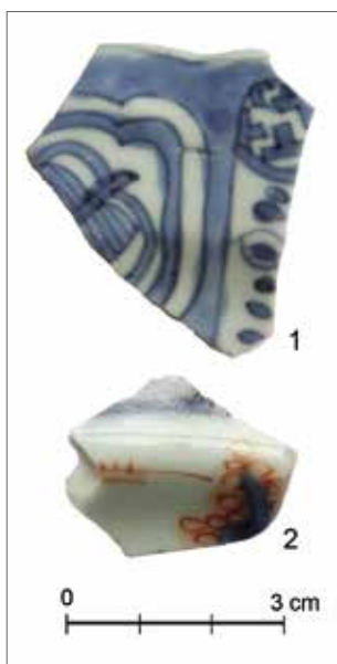
Obr. 11. Praha 1–Hrad, Zlatá ulička, výzkum Archeologického ústavu AV ČR, Praha. Výběr nálezů asijského porcelánu ze souvrství v ploše komunikace Zlaté uličky: 1 – přír. č. 1111; 2 – přír. č. 215. 1 – souvrství z rudolfínské přestavby (obr. 13: 2); 2 – mladší souvrství.

podíl těchto nálezů lze interpretovat skutečností, že se tato keramika vyráběla ve 2. polovině 16. až 1. polovině 17. století, tj. pochází ze staršího období než většina zkoumaných vrstev. Spíše sporadicky je zastoupena německá kameninová produkce. Do kategorie ojedinělých nálezů se řadí pět zlomků asijského porcelánu (obr. 11). Byly identifikovány čtyři fragmenty z dynastie Ming nebo rané Čching, pocházející s velkou pravděpodobností z oficiálních císařských manufaktur v Ting Te Čchenu. Toto zboží bylo dováženo do Evropy od 16. století, v Čechách lze vysledovat jeho výskyt především v závěru 16. až v polovině 17. století (DÍVIŠ 1985, 9, 10). Jedná se o modrobílé zboží (malba kobaltem pod transparentní glazuru). Vzácněji se vyskytuje červeno-modré malování se zlacením a transparentní glazurou ( imari ), které náleží porcelánu okruhu Imari a pochází pravděpodobně z Japonska, i když čínskou provenienci nelze vyloučit (KÜNZL/HOLTER 1998, 126).